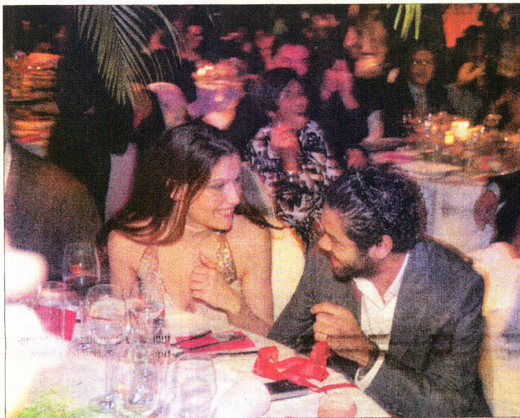
Laetitia Casta et Jamel Debbouze. Le comique français s'est improvisé assistant du commissaire-priseur. Show devant!